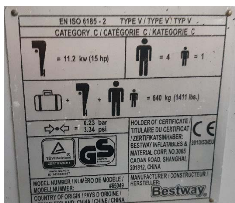
Mynd af CE merkingu fyrir skemmtibát

Skemmtibátur verður ekki fluttur inn á Evrópska efnahagssvæðið, nema hann sé CE-merktur. CE-merkingu er ætlað að tryggja að þeir skemmtibátar sem settir eru í notkun á svæðinu séu hannaðir og framleiddir í samræmi við viðeigandi staðla og uppfylla grunnkröfur reglugerðarinnar og hafi ekki í för með sér hættu fyrir öryggi og heilsu manna, eignir eða umhverfið. Nokkuð hefur verið um það að reynt hefur verið að flytja skemmtibáta án CE-merkis til landsins, einkum frá Bandaríkjunum. Þegar svo ber undir fæst báturinn ekki tollafgreiddur og verður innflytjandi hans þá að velja um hvort hann lætur CE-merkja bátinn, með tilheyrandi kostnaði, eða sendir hann aftur út fyrir EES-svæðið.